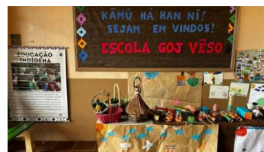
Figura 1. Experiências ecopedagógicas realizadas com crianças da Educação Infantil Kaingang.