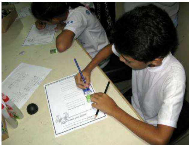
Figura 2 – Atividade com desenho e pinturas para identificar conhecimento sobre o tema

absorveram do conteúdo da oficina, com base na política dos 3rs, tais atividades proporcionaram identificar as habilidades de aprendizado, habilidade estratégica, coordenação fina e óculo manual, coordenação global, lateralidade, estruturação espacial, estruturação temporal, socialização.