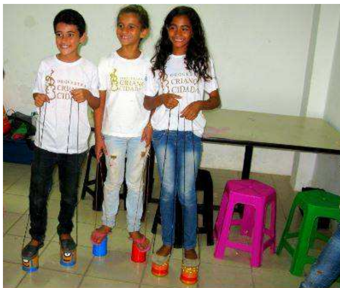
Figura 3 – Crianças com brinquedos elaborados na oficina

No terceiro dia, foram concluídos todos os brinquedos propostos e as próprias crianças e adolescentes fizeram os testes de uso que comprovaram a qualidade, segurança e eficiência dos brinquedos (Figura 3).