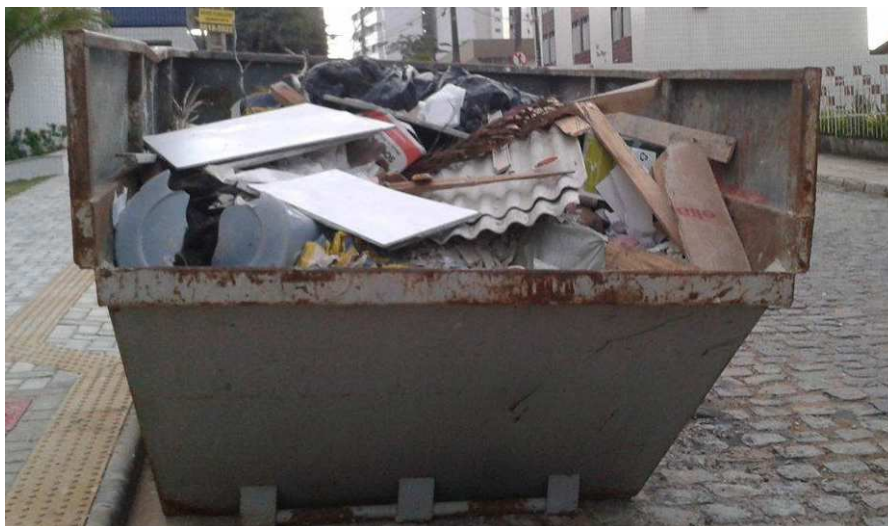
Figura 5: Caçamba para RCD em gerais.

Assim, durante a aplicação da ferramenta de estudo, os colaboradores informaram sobre a disposição dos resíduos no canteiro de obra, relatando a existência de duas caçambas de entulho na obra, sendo uma delas para sobras de concreto, tijolos, blocos cerâmicos, entre outros; e a outra somente para os detritos de gesso, em razão de sua reciclagem ser mais complexa do que os outros citados anteriormente. Desse modo, ao realizar os registros fotográficos, percebeu-se que, na prática, a segregação não era tão eficiente, a caçamba destinada para os RCD em gerais, excluindo o gesso, apresentava realmente uma diversidade muito grande, como se pode observar na figura 5 e de fato não apresentava sobras de gesso.