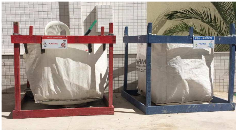
Figura 7: Presença da coleta seletiva na obra.

Acrescenta-se também o fato de na obra estudada haver o sistema de coleta seletiva entre o papel, metal, plástico e vidro que fossem gerados durante o processo de construção, cujos eram dispostos em coletores, como mostra a figura 7, denominados de “baias”.