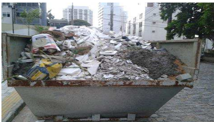
Figura 6: Processo de segregação inadequado.

Todavia a caçamba destinada unicamente para o gesso não apresentava apenas este, como se pode observar na figura 6, sendo fácil perceber a presença de outros tipos de resíduos, como latas de tintas, sobras de concretos, embalagens de cimento, embora esses também sejam altamente poluentes, por conterem resto de substâncias químicas; esse local estava destinado para o gesso pelo fato do complexo retorno ao processo de produção. Assim, havia uma falha na triagem no canteiro de obra, dificultando o processo de reciclagem e demonstrando uma insuficiência no Plano Integrado de Gerenciamento de Resíduos da Construção Civil (PGRCC) na obra, já que a separação não acontecia de forma eficiente, segundo Cabral e Moreira (2011); porém, ao passo que não inviabilizaria a reciclagem, acarretaria na necessidade de uma nova triagem por parte da indústria responsável pelos resíduos.