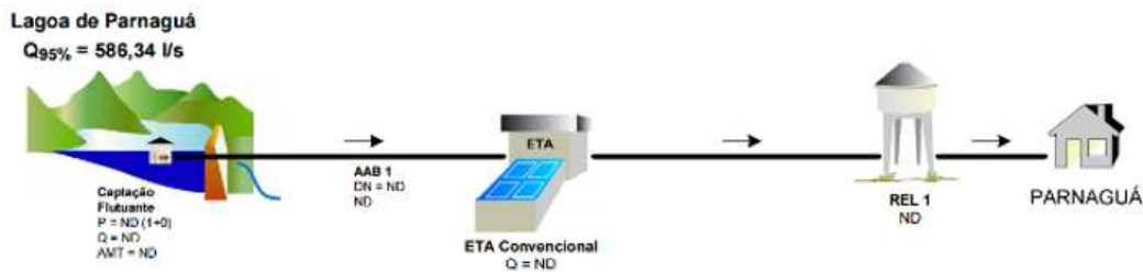
Figura 2: Modelo do sistema do abastecimento de água do município de Parnaguá - PI.

Em virtude da situação que ocorreu na lagoa o órgão competente pelo abastecimento da cidade Agespisa suspendeu o fornecimento de água oriunda do manancial, onde o recurso tornou-se insuficiente para o abastecimento. Contudo, de maneira emergencial, o município começou a ser abastecido por carro pipa, que seria uma solução em curto prazo e rápido diante da necessidade da população. Após isso, passaram-se alguns meses e o acesso à água potável dificultava cada vez mais. No entanto a Agespisa sentiu a necessidade de algo mais prático e durador, então tomou a decisão de perfurar poços artesianos para o abastecimento. Com isso, foram perfurados cinco (5) poços artesianos a fim de minimizar os problemas e transtornos a população (Figura 3).