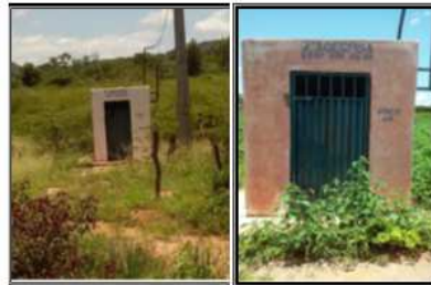
Figura 3: Poços de abastecimentos da cidade de Parnaguá-PI. Fonte: Levantamento de campo, 2016.

Em virtude da situação que ocorreu na lagoa o órgão competente pelo abastecimento da cidade Agespisa suspendeu o fornecimento de água oriunda do manancial, onde o recurso tornou-se insuficiente para o abastecimento. Contudo, de maneira emergencial, o município começou a ser abastecido por carro pipa, que seria uma solução em curto prazo e rápido diante da necessidade da população. Após isso, passaram-se alguns meses e o acesso à água potável dificultava cada vez mais. No entanto a Agespisa sentiu a necessidade de algo mais prático e durador, então tomou a decisão de perfurar poços artesianos para o abastecimento. Com isso, foram perfurados cinco (5) poços artesianos a fim de minimizar os problemas e transtornos a população (Figura 3).