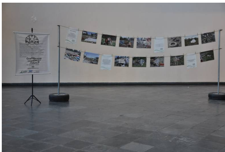
Figura 6: Varal traz as fotografias de locais com focos irregulares de res duos