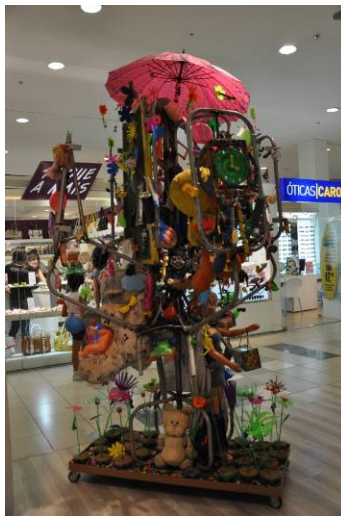
Figura 4: Árvore “Mutaç o da Inf ncia”, recoberta com brinquedos