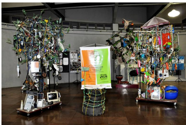
Figura 5: A Mostra em exposiç o