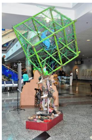
Figura 2: Árvore “Nossas Pegadas” recoberta com resíduos de couro