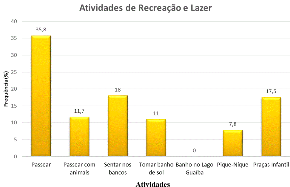
Figura 4 – Atividades de recreação e lazer realizadas pelos usuários no Parque.

As atividades de contemplação foram as mais destacadas pelos usuários, sendo que a apreciação do pôr-do-sol foi de 43,5% e contemplação da flora 54,5%, destacando as árvores como a vegetação que chama mais atenção ao público (88,5%).