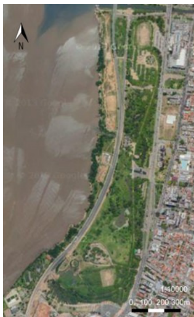
Figura 1 - Mapa do Parque Marinha do Brasil, Porto Alegre/ RS.

Atualmente o Parque, além de oportunizar local para a socialização e o contato homem-natureza, possui ambientes para lazer e a maior área para práticas esportivas do município, ofertando à população porto-alegrense: campos de futebol; quadras de basquete, futebol de salão, vôlei e tênis; pistas de atletismo, ciclismo, skate e patinação. Dentre os ambientes para lazer, destacam-se: o Recanto Solar (Solário), destinado para banhos de sol; o Recanto da Saudade, às margens do Lago da Saudade; e os Recantos Infantis, basicamente pracinhas e um parque de diversão, denominado Parque Guaíba.