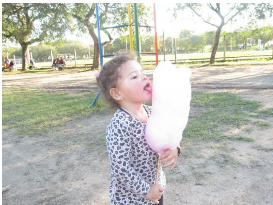
Figura 5 – Passeio de domingo com a família no Parque.

A realização de caminhada (44,4%) e andar de bicicleta (17,9%) foram as práticas esportivas mais citadas pelos usuários. Para as atividades de lazer, o ato de passear evidencia-se sobre as demais atividades, todavia nota-se os passeios com animais e as atividades recreativas nas praças infantis citadas como atividades realizadas no Parque.