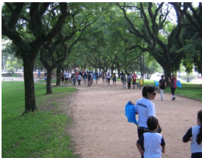
Figura 2 - Utilização da área do Parque Marinha para o desenvolvimento de atividades esportivas e recreativas.

Notou-se que a maioria dos entrevistados visita o Parque mais de uma vez por semana (52,5%), sendo os dias mais frequentados pelos usuários a quinta-feira (39,5%) e o sábado (75,5%). O período de maior fluxo no parque é o da manhã (79%) e os usuários sentem-se mais seguros no período matutino (79%).