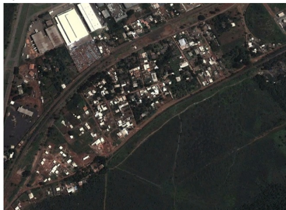
Figura 2: Ocupação de áreas no Distrito Federal

A figura apresenta a evolução da ocupação do Setor de Chácaras do Setor Habitacional Lúcio Costa. Uma das áreas do Distrito Federal que ainda não está regularizada e por isso não possui serviços públicos básicos, inclusive implantação de áreas verdes urbanas. Na primeira imagem datada do ano de 2002 haviam espaços naturais remanescentes. A morosidade na regularização da área fez com que as chácaras fossem divididas em terrenos menores de forma irregular, sem prever espaços para a implementação de áreas verdes urbanas.