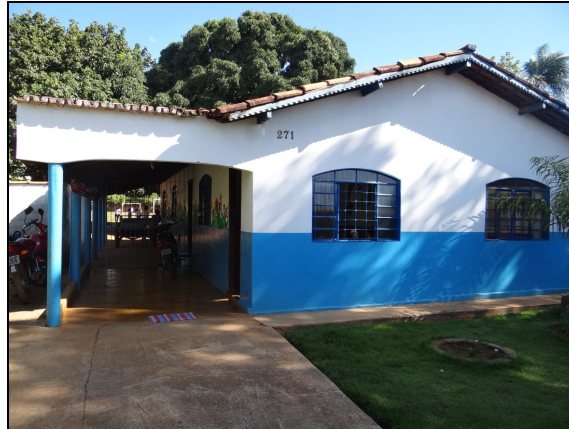
Figura 3 - Colégio Emílio Blanke.