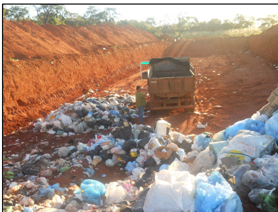
Figura 4 - Aterro Controlado de Bela Vista.

Na figura 4 é apresentada uma imagem da situação do Aterro Controlado de Bela Vista.