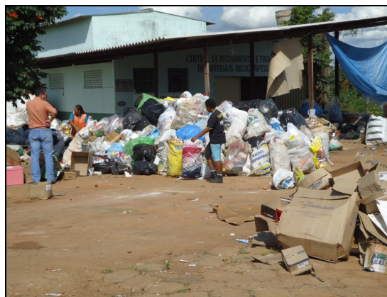
Figura 5 - Central de Recebimento e Triagem de Materiais Recicláveis.

Desta forma, observa-se que o Aterro Controlado de Bela Vista de Goiás não oferece uma trincheira específica para acomodação do lixo hospitalar, sendo que o mesmo é disposto na mesma vala que os resíduos domésticos, ocorrendo posteriormente o soterramento e a compactação parcial.