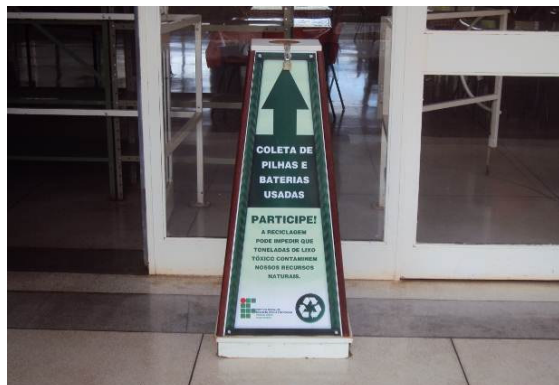
Figuras 01 e 02: Lixeiras destinadas ao recolhimento de papéis e pilhas/baterias.

A comunidade escolar foi instruída a segregar os resíduos considerados potencialmente recicláveis dos resíduos considerados orgânicos e/ou rejeitos. Foram disponibilizadas lixeiras personalizadas em locais estratégicos de modo que as pessoas tenham o recipiente adequado para dispor o resíduo quando necessitar.