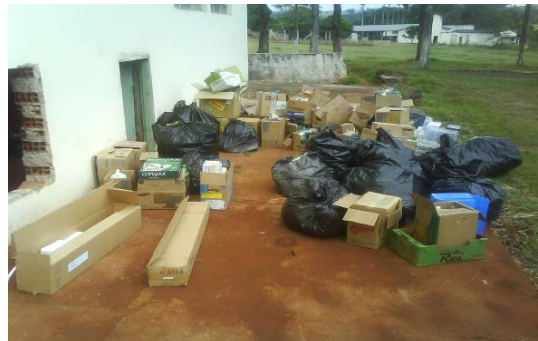
Figuras 07 e 08: Depósito de recicláveis. Amostra de material recolhido no Programa de Coleta Seletiva