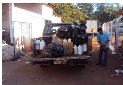
Figuras 09 e 10: Transporte de recicláveis para a Associação de Catadores.