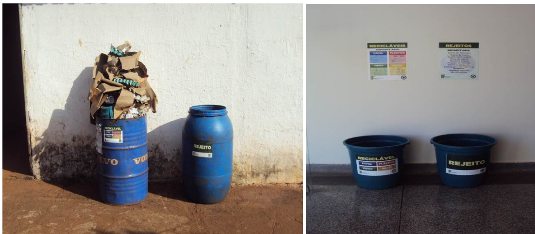
Figuras 03 e 04: Lixeiras destinadas ao recolhimento de material reciclável em setor produtivo (avicultura) e em corredor do prédio pedagógico.

depositado. Adotando esta estratégia, diferentes recipientes foram utilizados como lixeiras, independente de cor, tamanho, formato e material (Figuras 03, 04, 05 e 06).