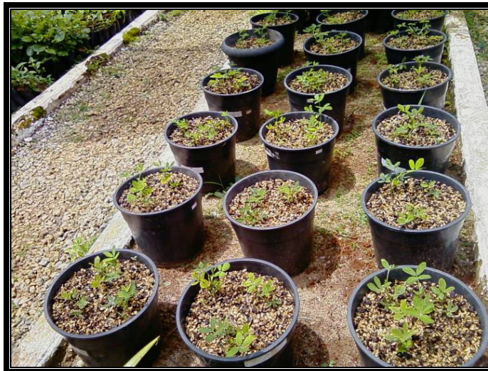
Figura 01. Seis acessos de amendoim forrageiro plantados em vasos com três repetições, Inconfidentes/MG.

Foram utilizados cinco acessos da espécie A. pintoi (BRA 031496, BRA 015121, BRA 013251, BRA 030333 e BRA 022683) e um acesso da espécie A. repens (BRA 031801). Todos os acessos foram trazidos em janeiro de 2006 da unidade EMBRAPA Agrobiologia, localizada no município de Seropédica/RJ. A pesquisa se estabeleceu em vasos de 5 litros, onde foram selecionadas nove mudas por acesso, homogêneas em relação ao tamanho da muda, quantidade e tamanho das folhas, para plantio de três mudas por vaso, conforme figura 01.