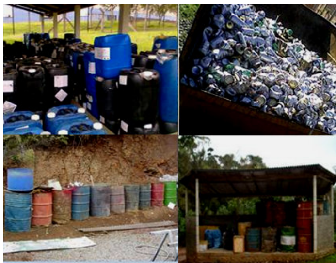
Figura 02: Segregação dos resíduos ocorridas nos canteiros de obras ou nos municípios em questão

A segregação dos resíduos (figura 02) teve como finalidade evitar a mistura aqueles incompatíveis, visando garantir a possibilidade de reutilização, reciclagem e a segurança no manuseio. Todos os funcionários serão devidamente treinados sobre a correta separação, acondicionamento, transporte e destinação final dos resíduos líquidos e sólidos e o que a mistura de resíduos incompatíveis pode causar.