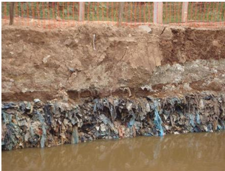
Figura 2. Características do lixo enterrado no bairro.

Mesmo com o histórico de impacto, está instalada uma riqueza ecológica muito significativa, já que ao centro do bairro está uma das últimas áreas alagadiças/úmidas preservadas (Figuras 3 e 4). As relações ecológicas são bastante expressivas neste ambiente, mesmo localizado em zona urbanizada e parte de um grande processo de parcelamento de solo, constitui-se de um patrimônio da capital, pela sua diversidade de espécies.