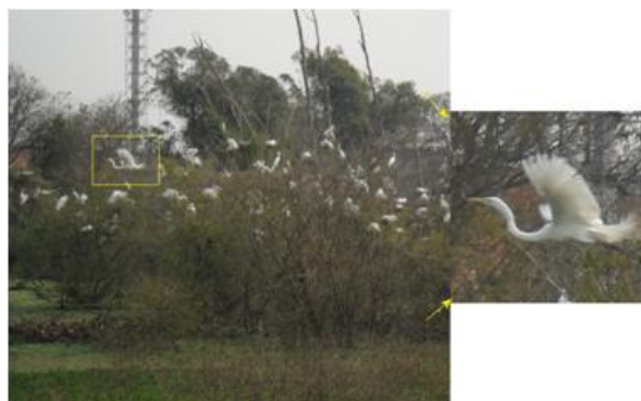
Figura 4. Fauna do Parque, garças.

Trabalhar a questão ambiental em meio urbano requer o entendimento da realidade instalada e o conhecimento da percepção dos moradores desse local. Até então, este artigo se preocupou em destacar as características ecológicas presentes no bairro, pois durante a entrevista com os moradores do bairro, o recurso natural mais citado nas falas foi a vegetação, tanto relacionada ao parque quanto aos demais espaços verdes do bairro. Entre os entrevistados, 90% declararam que não imaginam o bairro sem o parque, e 70% disseram que o que mais gostam no bairro são os espaços verdes. Esta característica confere ao bairro um aspecto harmonioso em relação a outros lugares na cidade, que já estão tão densificados.