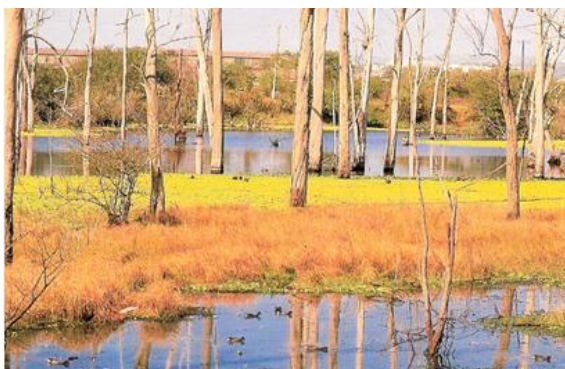
Figura 3. Alagadiço do Parque.