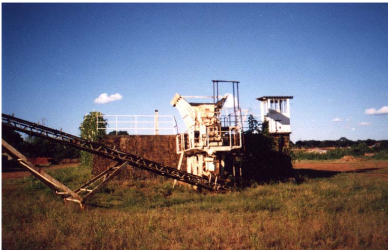
Figura 1. Usina de Reciclagem de RCC.