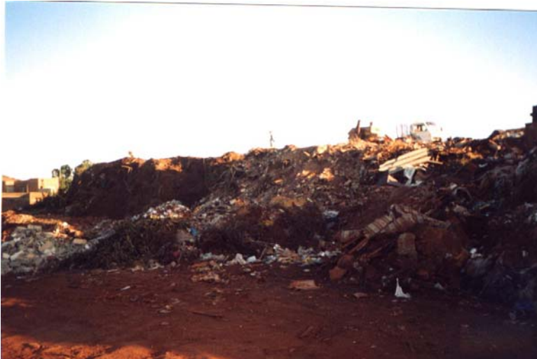
Figura 2. Área de disposição dos RCC.

Ribeirão Preto possui uma Usina de Reciclagem, que se encontra desativada por motivo da falta de contratação de vigilância no local e também pela falta de legislação que obrigue os caçambeiros a depositarem o entulho recolhido nesta usina. Uma vez que o material reciclado gerado na usina era de granulometria irregular, o mesmo era utilizado na pavimentação de estradas municipais e ruas sem asfalto. Mas, o que ocorre em Ribeirão Preto, é que a distância da usina em relação aos diversos pontos da cidade é grande, logo, as empresas responsáveis pela coleta dos RCC preferem áreas mais próximas, diminuindo seus custos com transporte. Na ocasião, verificou-se o abandono dos equipamentos, alguns até sem condições de uso futuro (Figura 3).